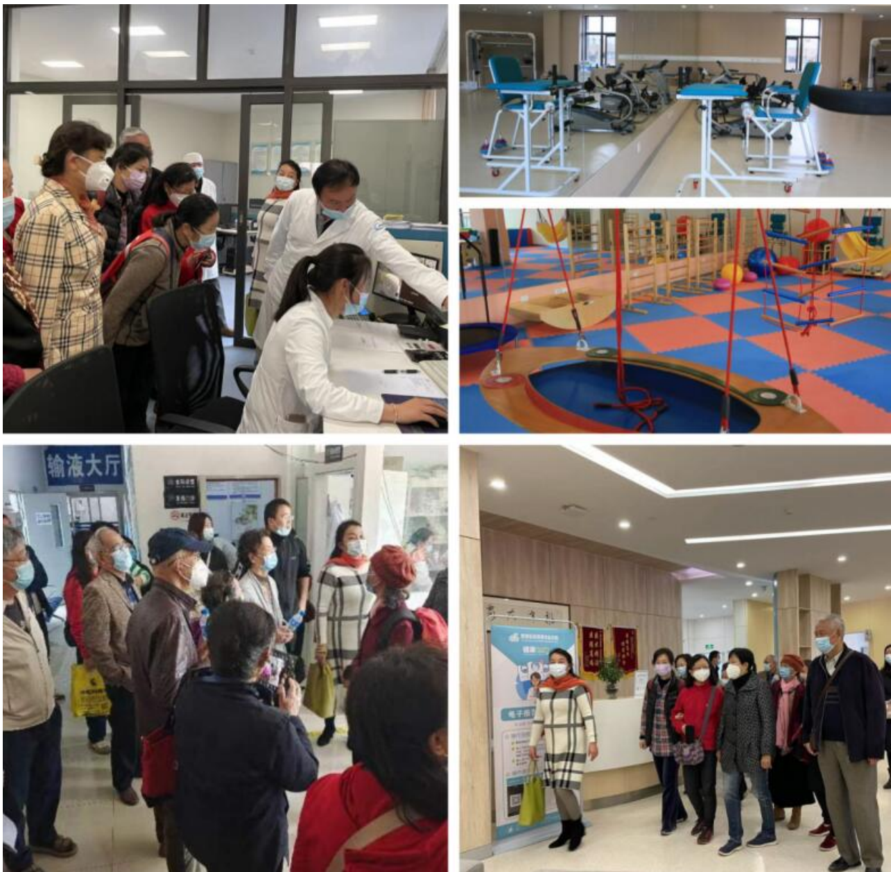
参观团队在胡中院长的带领下走访医院的各个部门

昆明官房康复医院是一家医养结合的医疗机构，为老年人养老专门设置了康养照护中心，可收养多种家庭需求的老人。医院是云南省首批通过长护险的定点单位，参保老人可在官方康复医院享受相关护理服务，减轻家庭的负担。