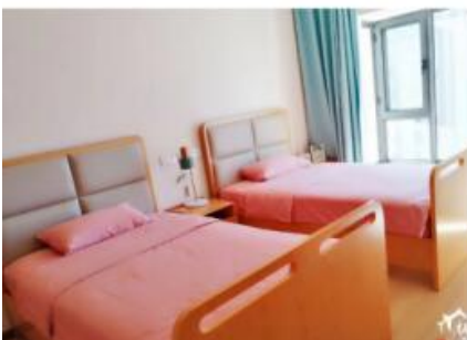
专家团队于现场看到的栖云阁养生公寓的设施