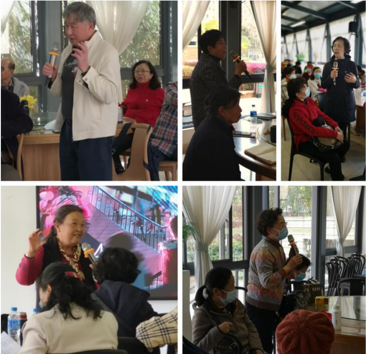
专家们在座谈会上纷纷发言

在研究会工作人员询问活动参与人员的意见和建议时，绝大多数专家对活动的安排和内容予以了肯定，另呼吁精神家园可考虑再次安排类似的养老机构参观活动，另希望参观时间可以更充裕一些。下午16：00时，参观活动圆满结束。