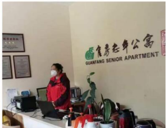
位于一环边的官房老年公寓交通便捷