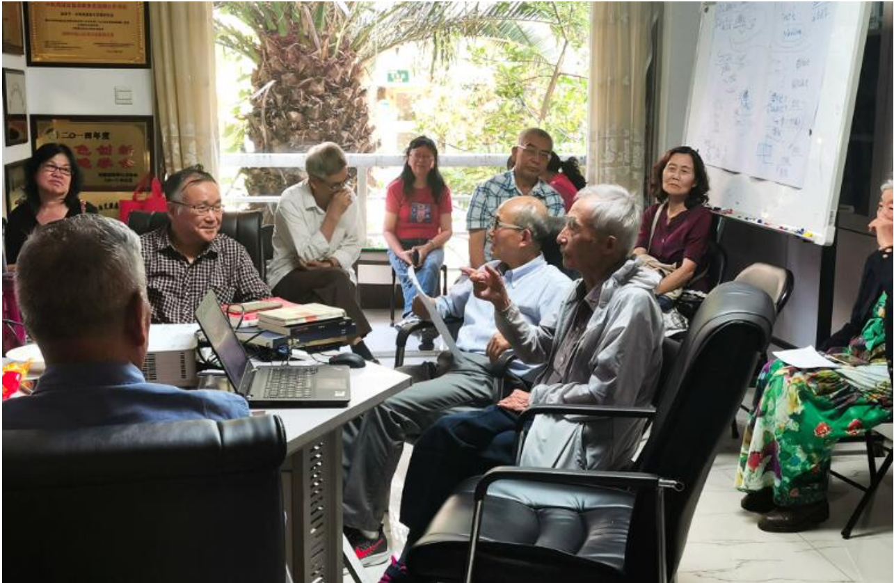
伍法同老师简要介绍了两个“维度”的养老

时光匆匆，下午五点，YHDRA举办的“做好老年规划，安享老年生活”线下交流会圆满结束。专家老师们意犹未尽，一边离场一边在最后的的时间里继续交流。YHDRA也期待与专家老师们再次见面！