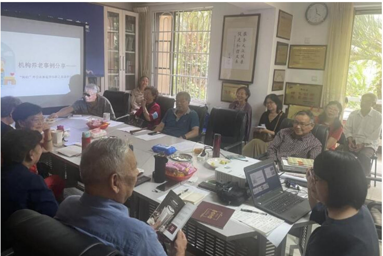
商艾思老师分享《“90”后外公在新昆华乐龄之家康养中心》案例